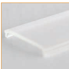
1,5 mm x 21 mm

Al Profil mit hoher Kühlleistung und Schwenkhalterung (L x H x B) 2.000 mm x 29 mm x 25,4 mm Aluminum profile for high thermal load and integrated adjustable mounting bracket (45°) (L x H x W) 2,000 mm x 29 mm x 25,4 mm