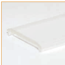
1,5 mm x 21 mm