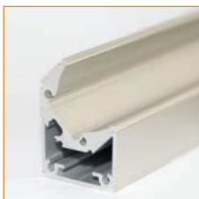
29 mm x 25,4 mm