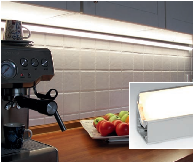
007 UnderCabinet APOLL0935 ClearCover 007 UnderCabinet APOLL0935 ClearCover