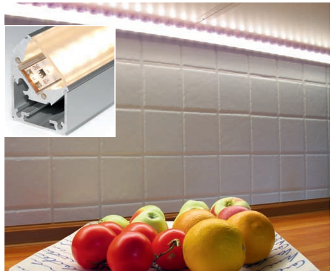
007 UnderCabinet APOLL0935 Clear Cover - 01 007 UnderCabinet APOLL0935 Clear Cover - 01